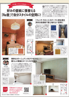
リライフプラスVOL.21掲載

主婦向け雑誌「ESSE」4月号、住まいインテリア誌「住まいの設計」3・4月号、「リライフプラス」VOL.21にRe壁関連記事を掲載。